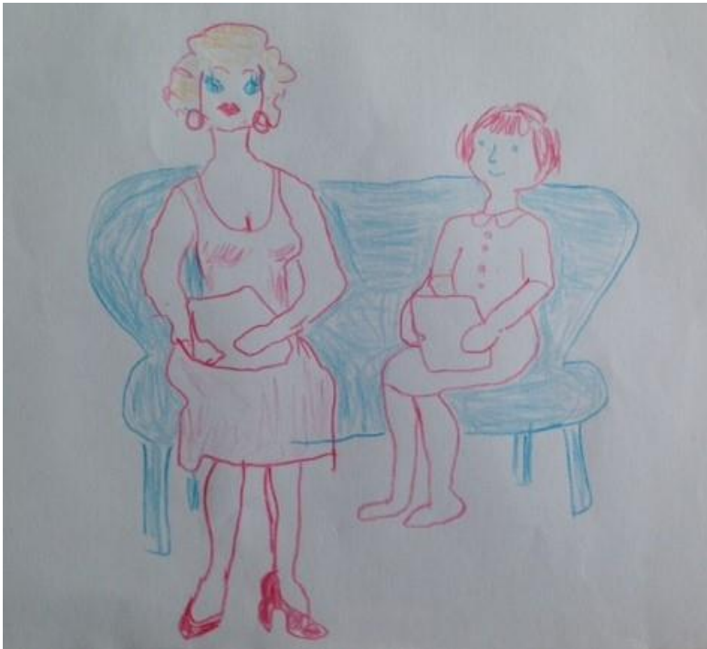
Illustration av en berättelse: "På helgerna besökte jag ofta min far och hans nya vackra fru. Hon lärde mig många saker, bland annat att brodera"