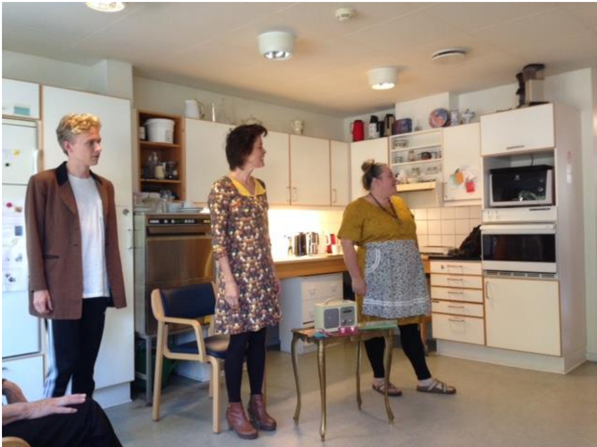
Ett skådespel på Bakkehusets äldreboende

Föreställningen på bilden visades i avdelningens dagrum/kök. Publiken bestod av sju äldre personer med demens och lika många personer ur personalen. Skådespelet tog knappt 15 minuter.